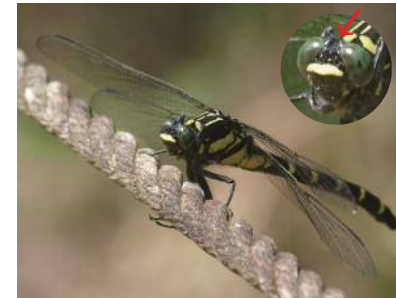
13. コオニヤンマ (サナエトンボ科) ・5~9月・大きさ75~93mm ・きゅうりょう地のまわりに、木々のある川など

黒い体に黄色のしまもよう、緑色の目がとくちょう。ようちゅう(ヤゴ)の期間は長く3~4年。