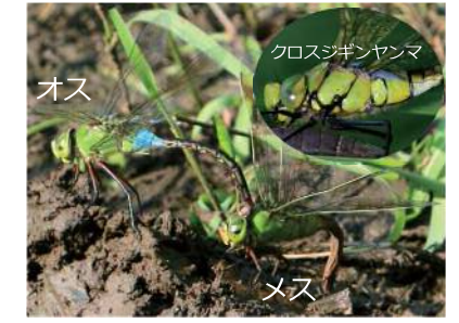
14. ギンヤンマ (ヤンマ科) ・5~10月・大きさ65~84mm ・平地から山地のひらけた池、ぬま、川など

オスのおなかのつけ根は水色でメスは黄緑色。クロスジギンヤンマはむねに黒いすじがある。