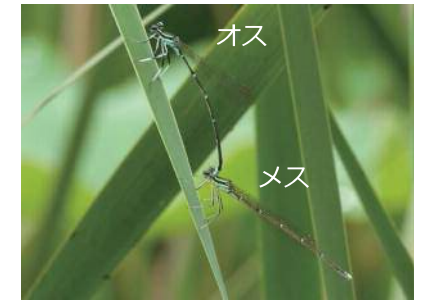
11. モノサシトンボ (モノサシトンボ科) ・6~10月・大きさ38~51mm ・平地から山地の周囲に林のある池や沼、流れのゆるい河川など

あざやかな水色がよく目立つ細長いトンボ。成虫で冬をこすため、冬になると全身が茶色に変わり木のえだなどになりきる。