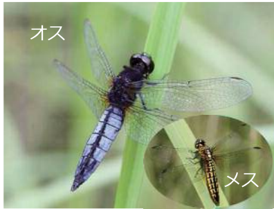
7. ハラビロトンボ (トンボ科) ・6~8月・大きさ33~42mm ・平地からひくい山地の池、ぬま、しっ地など

おなかかひらべたいトンボ。オスの目とむねは黒く、おなかには青白いこなをふく。メスは体全体が黄色い。わかいオスは、メスと同じような色をしている。