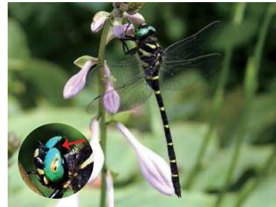
12. オニヤンマ (オニヤンマ科) ・6~10月・大きさ82~114mm ・平地から山地の木々にかこまれた池、ぬま、しっ地など

黒い体に黄色のしまもよう、緑色の目がとくちょう。ようちゅう(ヤゴ)の期間は長く3~4年。