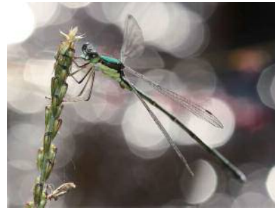
9. オオアオイトトンボ (アオイトトンボ科) ・6~11月・大きさ40~55mm ・平地から山地の木々にかこまれた池、ぬま、しっ地など

オスは、むねとおしりの先に青白いこなをふく。はねを半開きにしてとまるのが、アオイトトンボのなかまのとくちょう。