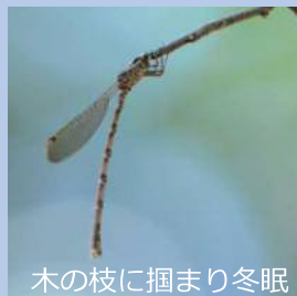
木の枝に掴まり冬眠

多くのトンボの仲間は冬になると卵やヤゴ（幼虫）で冬眠しますが、ホソミオツネトンボは成虫で冬眠する変わり者です。成虫で冬眠することで、春になると他のトンボよりもいち早く水辺に