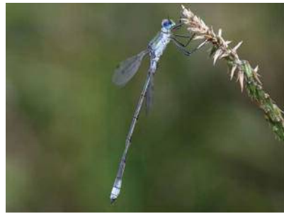
8. アオイトトンボ (アオイトトンボ科) ・5~9月・大きさ34~48mm ・平地から山地の池、ぬま、しっ地など

おなかかひらべたいトンボ。オスの目とむねは黒く、おなかには青白いこなをふく。メスは体全体が黄色い。わかいオスは、メスと同じような色をしている。