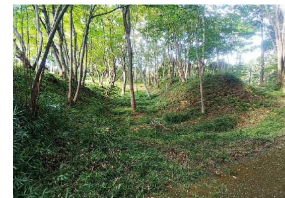
遺構を見せる維持管理