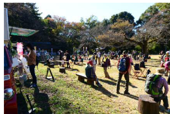
約1,000人を動員した滝山城カフェ