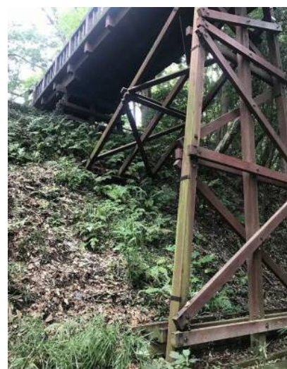
引橋 滝山公園園内