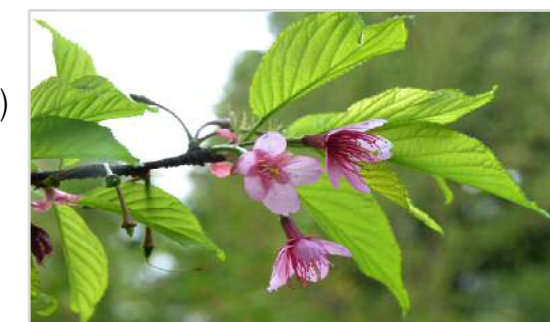
4月上旬 カンヒザクラ