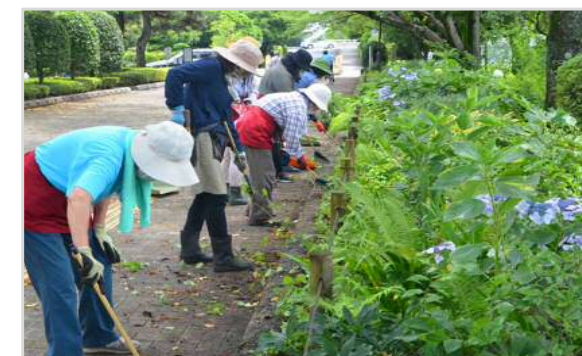
夏のお手入れ活動の様子