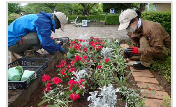
花壇植え付けの様子