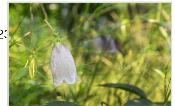
6月上旬 ホタルブクロ