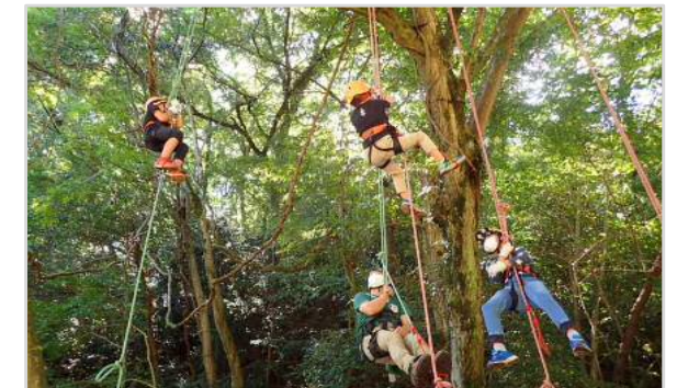
木のぼり教室の様子