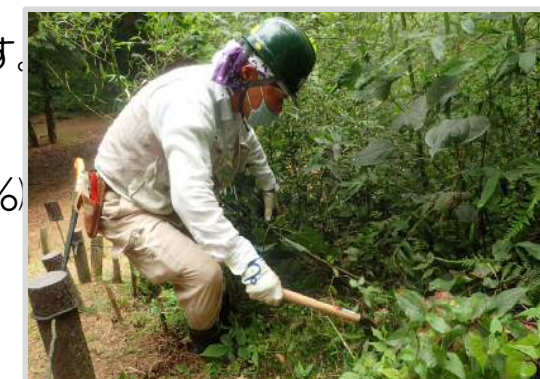
ボランティア活動の様子