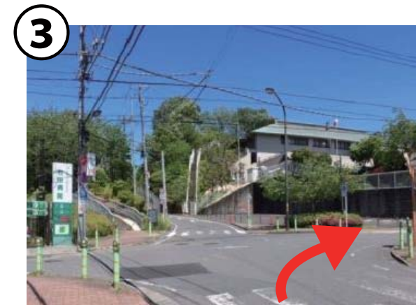
③ 右田病院の交差点を右折、道なりに進む