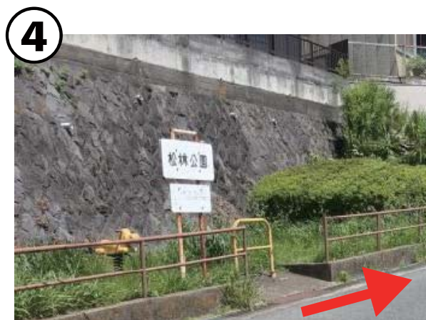
④ 松林公園の前を通過、次のT字路を右折