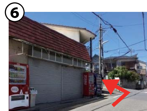
⑥ すぐまた左折、3台の自販機あり

都立小宮公園サービスセンター 〒192-0043 八王子市暁町 2-41-6 TEL:042-623-1615