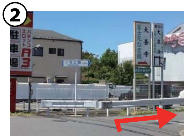
② 最初のT字路を右折「小宮公園→」の表示あり