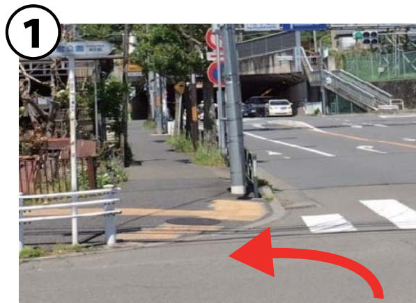
① ひよどり山トンネル方向に向かう最初の信号を左折「←小宮公園」の表示あり