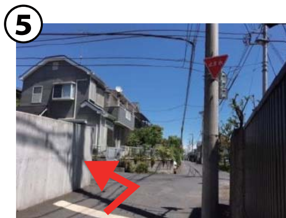
⑤ ここで左折「止まれ」の標識あり